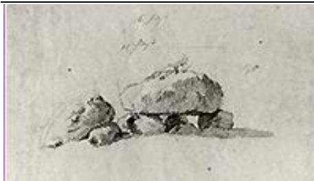
Skizze Hünengrab bei Gützkow von „CDF“.