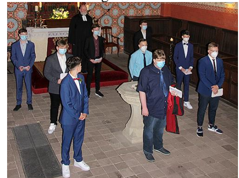
Denkwürdiges Konfirmationsfoto vorm Altar.

firmandinnen und Konfirmanden dieses Jahrgangs werden zum größten Teil am 14. August konfirmiert.