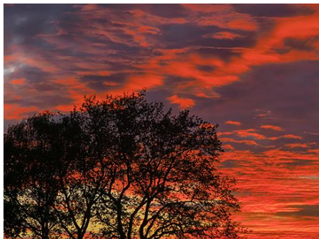
Abendhimmel in den letzten Maitagen

Es gibt eine Idee, die einst die Welt in Bewegung setzen wird: Dass Gott den Menschen nicht als Konsumenten und Produzenten erschaffen hat; dass das Lebensmittel nicht Lebenszweck ist; dass der Magen dem Kopf nicht über den Kopf wächst; dass das Leben nicht in der Ausschließlichkeit der Erwerbsinteressen begründet sei; dass der Mensch in die Zeit gesetzt sei, um Zeit zu haben, und nicht mit den Beinen eher irgendwo anzulangen als mit dem Herzen. Karl Kraus