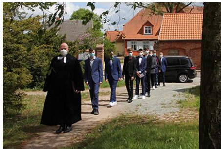
Einzug in diesem Jahr wegen der Besucherobergrenze ohne Geleit der Kirchenältesten