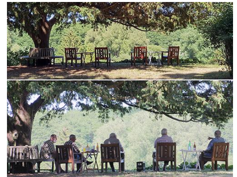
Feierabend-Männerrunde traf sich erstmalig nach der Corona-Pause unter dem ältesten Baum bei einem Feierabendbier.

auseinanderzubrechen drohten oder über das Dach des Nachbargebäudes oder des Pfarrhauses wuchsen. Nun, im Sommer, genießen alle den herrlichen Ausblick über das Tal des einstigen Mühlfließes und den kühlenden Schatten der riesigen, alten Baumkronen.